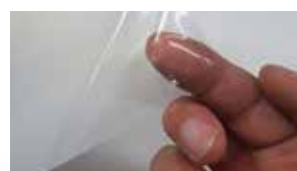
Transparent et flexible.