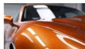
Les rayures disparaissent d'elles-mêmes !