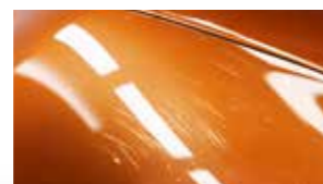
Leichte Kratzer in der PPF