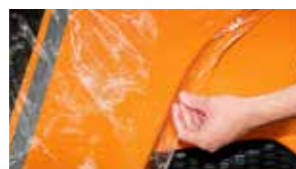
Müheless zu montieren.