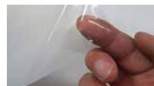
Glasklar und flexibel.

Die Unterschiede sind deutlich: (1) eine glänzende Oberfläche ohne Orangenhaut, (2) eine Elastizität von bis zu 360 %, (3) die Fähigkeit, Kratzer innerhalb von 10 Minuten selbstständig verschwinden zu lassen, ganz ohne Wärmezufuhr, und (4) die Möglichkeit, die Folie während der Montage endlos zu korrigieren, ohne Klebestreifen oder Spuren zu hinterlassen. Diese Eigenschaften machen Omega-Shield™ zu einer besonders benutzerfreundlichen und hochwertigen PPF-Folie für jeden Installateur.